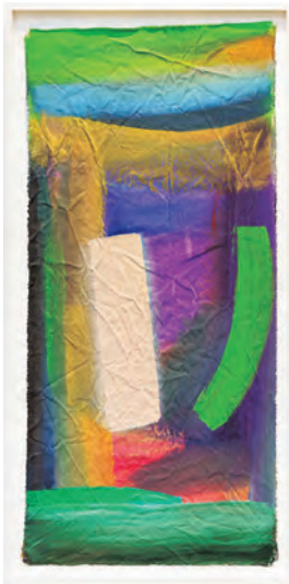
左—無題 2015 キャンバスにアクリル 絵具 90.2×41.9cm